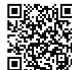
PETRA Broad Band